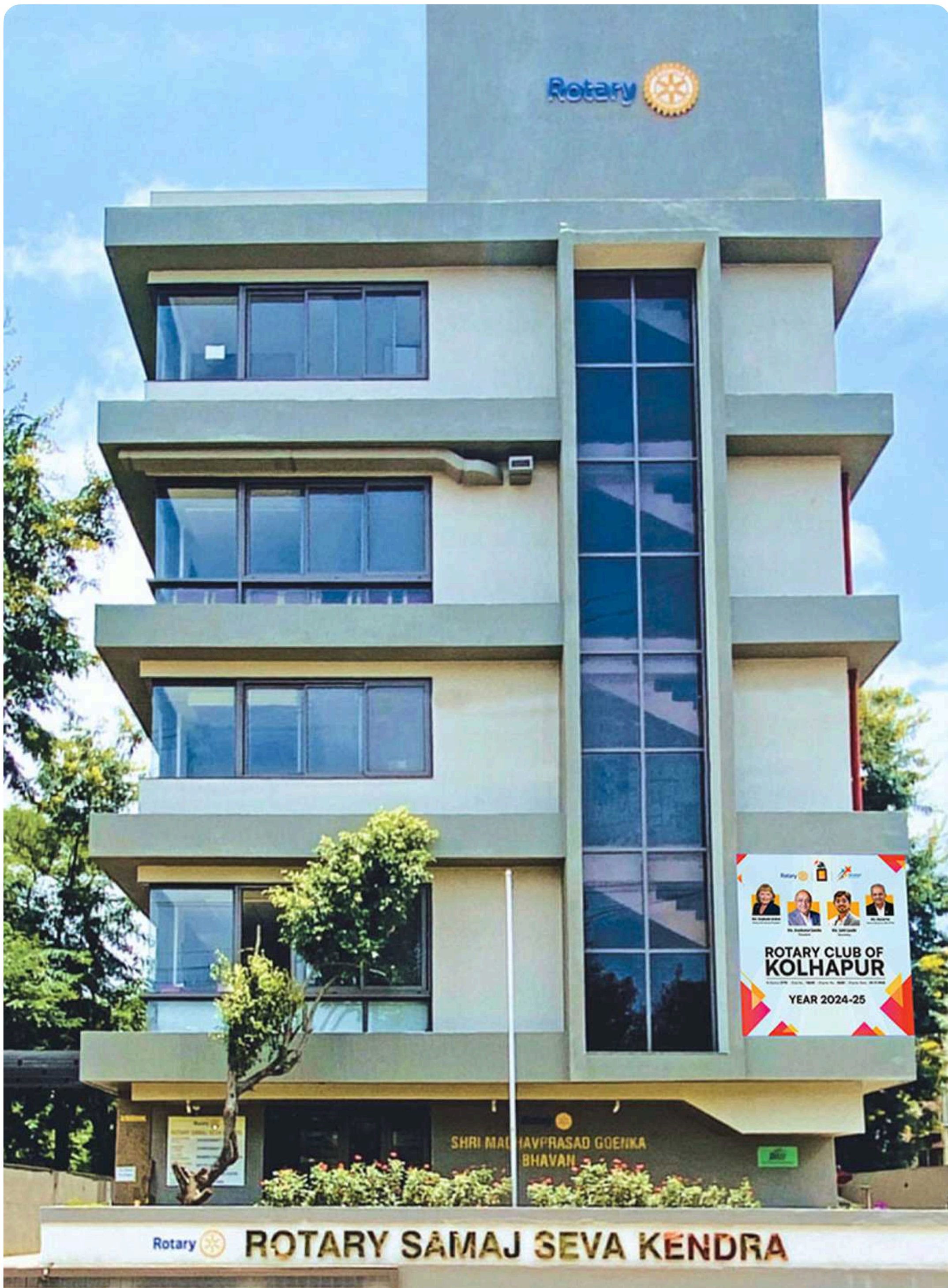
ROTARY CLUB OF KOLHAPUR'S ROTARY SAMAJ SEVA KENDRA BUILDING